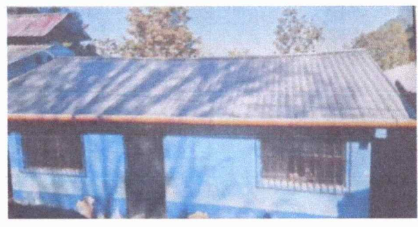
Foto 2: Se necesita la colocación de canales de agua, se encuentra en mal estado.