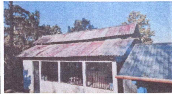
Foto 1: Se necesita el cambio de techo y costaneras, se encuentra en mal estado.