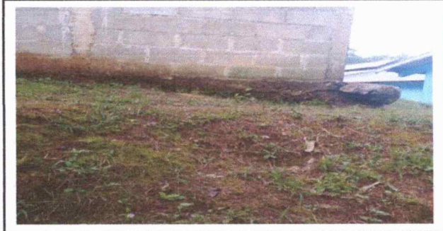
Foto 6: Se observa la escuela, hundiéndose la tierra por la rampa, dejando en riesgo a las familias cercanas.

Observación: Si es necesario se pueden agregar hojas adicionales y actualizar el número de hojas.