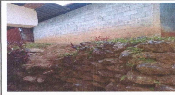
Foto 5: Se observa el muro decaído posterior de la escuela, se encuentra en mal estado.