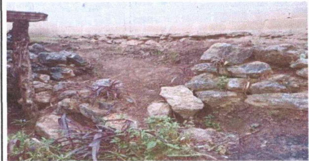
Foto 4: se observa el muro decaído, dejando familia arriesgado, se encuentra en mal estado.